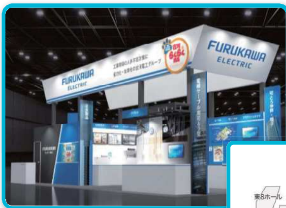
※ブースはイメージです。