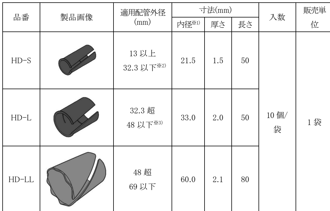
表-3 品番および構成材料

本製品の各品番の適用配管外径と寸法を表-3 に示します。また本製品の特性を表-4 に示します。